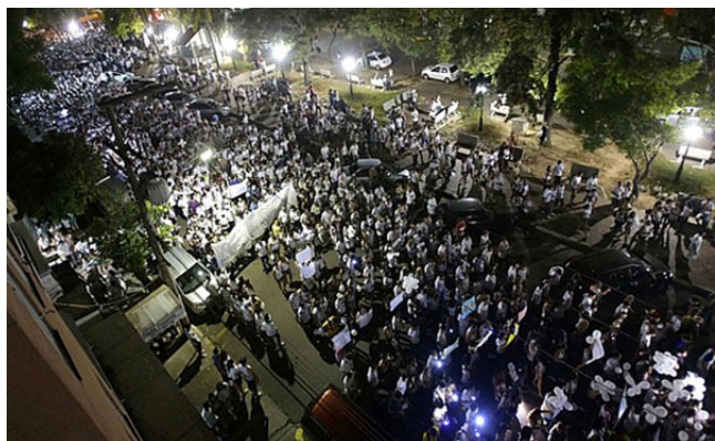
Mais de 35 mil pessoas caminharam pelas ruas de Santa Maria na noite de 28/01